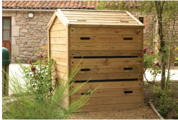
Composteur bois - Parc du Puy du Fou