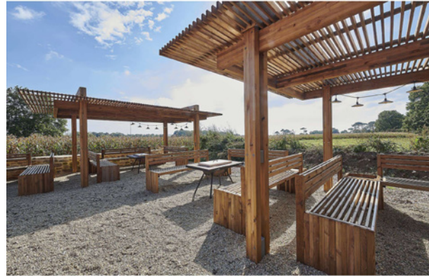
Restaurant La Charrue, Arradon (56)